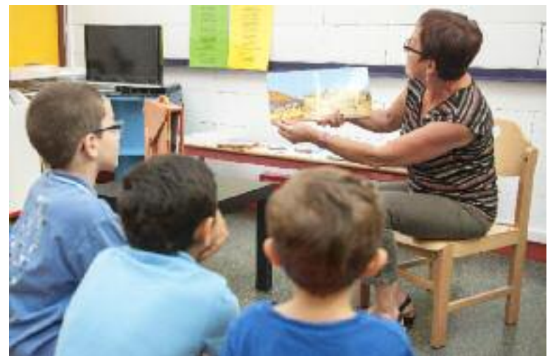
Un voyage à travers le livre Heureux qui comme les petits Vaudais ont fait un beau voyage... La 11 e édition d'A Vaux les livres les petits se déroule jusqu'au 20 juin. Cette collaboration entre les bibliothèques et le service Petite enfance avec le soutien de la CAF permet aux enfants d'être sensibilisés à la lecture. Des sélections d'albums autour du thème du voyage sont proposées dans le réseau des bibliothèques ainsi que des animations.