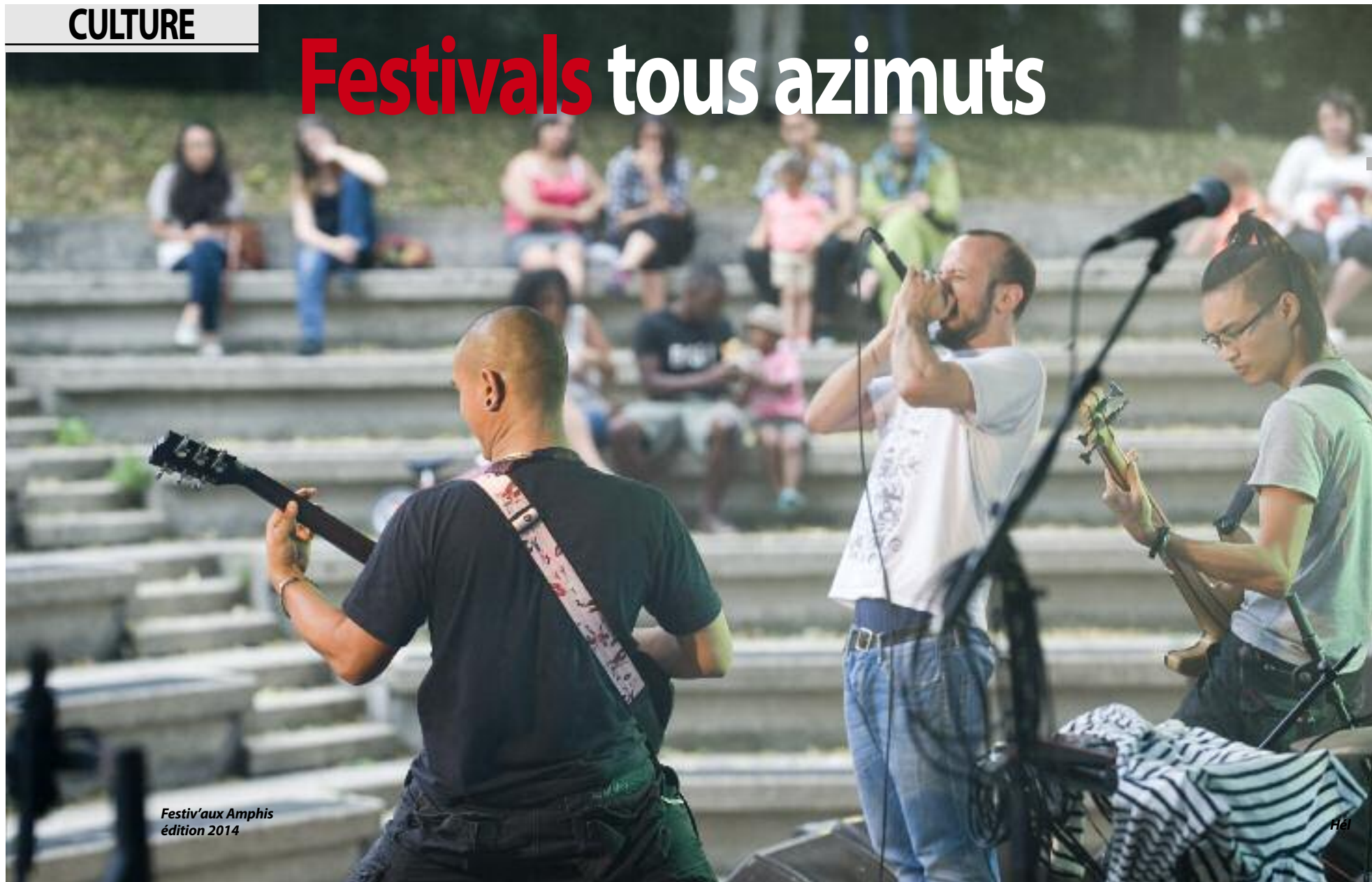
Festiv'aux Amphis édition 2014