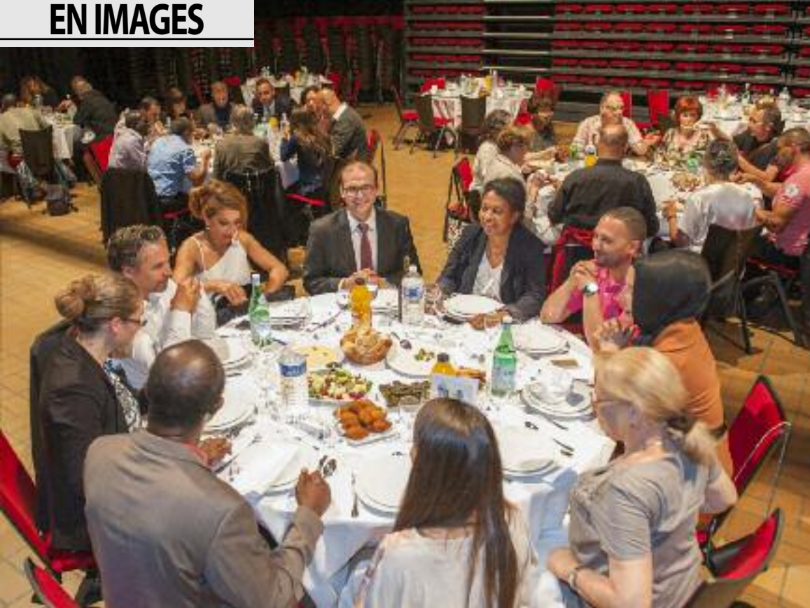
Le vivre ensemble se partage autour d'un repas C'est au centre culturel Charlie-Chaplin que le Gala des dîners du vivre ensemble s'est déroulé vendredi 12 juin. Organisée par la Maison des dialogues, avec le soutien de l'Espace projets interassociatifs (EPI) et la Ville, la soirée a rassemblé plus de 150 convives. Des personnalités du monde associatif, sportif et culturel étaient réunies autour des tables pour faire émerger des propositions qui alimenteront le Plan de lutte territorial contre le racisme, l'antisémitisme et les discriminations.