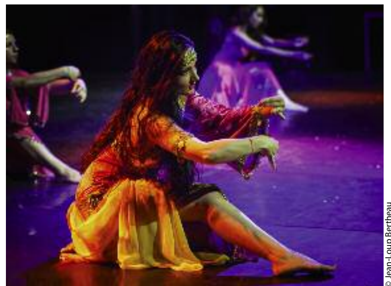
Fête de la MJC, toute une saison en lumière Comme chaque année, la fête de la Maison des jeunes et de la culture, clôturant la saison, a remporté un vif succès. Sur la scène du centre culturel Charlie-Chaplin la plupart des activités culturelles, corporelles et sportives ont été représentées : danse berbère, zumba, danse africaine, full contact, karaté, éveil cirque... Le tout dans une ambiance joyeuse et lumineuse, puisque la fête avait la lumière pour thème. Maintenant, pleins feux sur la programmation 2015-2016.