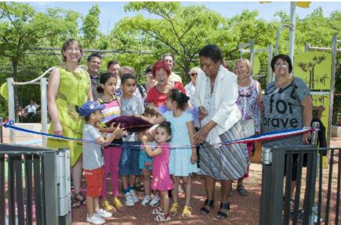
Les jeux du jardin du centre ville inaugurés Les nouveaux jeux d'enfants du jardin de la Paix et des Libertés ont été inaugurés samedi 13 juin, en présence de familles, d'élus et de membres du Conseil de quartier du centre ville. Le projet est né d'un travail collectif réalisé avec les services techniques municipaux. Cette action participe à l'amélioration du cadre de vie.