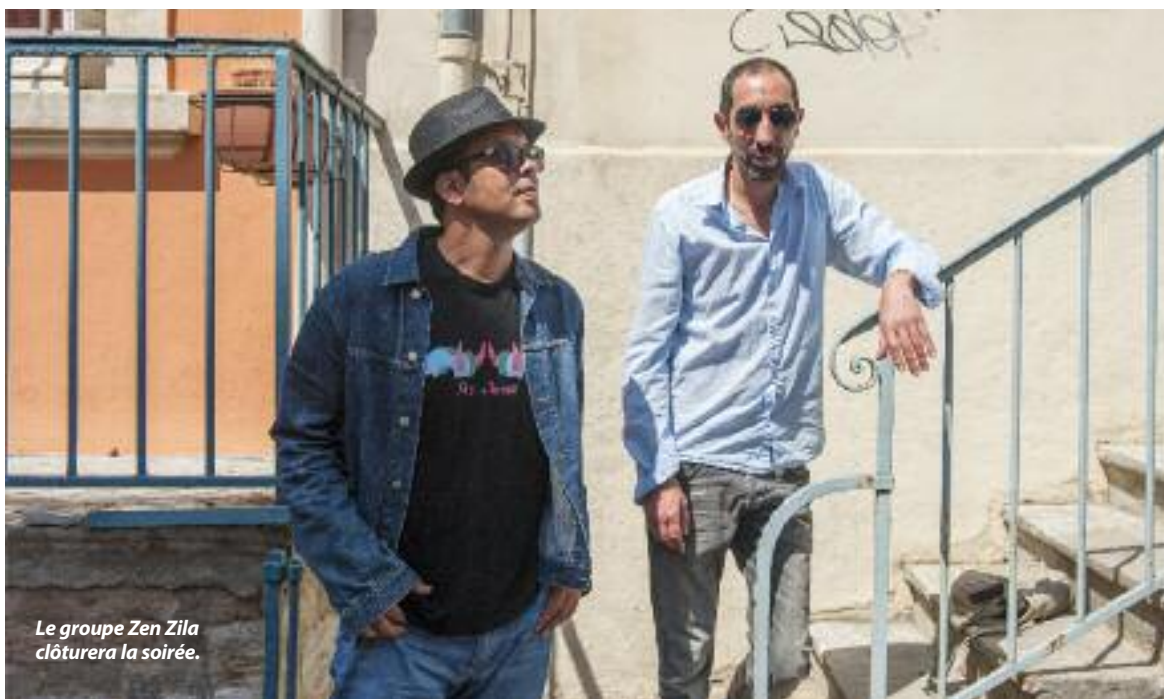
Le groupe Zen Zila clôturera la soirée.