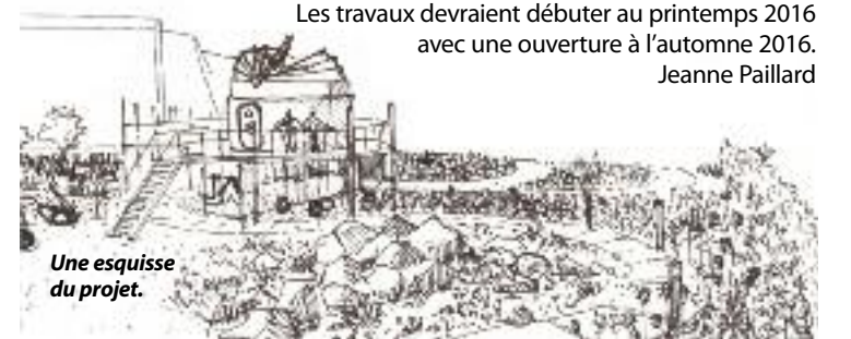
Une esquisse du projet.