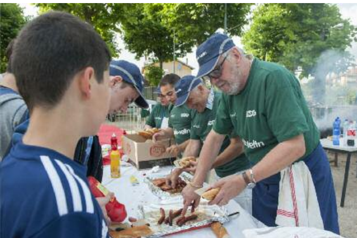
Un barbecue pour remercier l'engagement bénévole Comme il est de coutume, les élus ont retroussé leurs manches et passé leurs plus beaux tabliers pour offrir aux bénévoles des clubs sportifs de la ville, un grand barbecue festif, lundi 15 juin, avec le concours du service municipal des sports et de l'OMS. Cette année, l'évènement a quitté le stade Francisque-Jomard pour prendre ses quartiers au Sud, dans l'enceinte du stade Edouard-Aubert. Nombreux étaient les bénévoles à avoir répondu présent à ce moment convivial pour déguster une merguez et rencontrer les autres dirigeants sportifs.