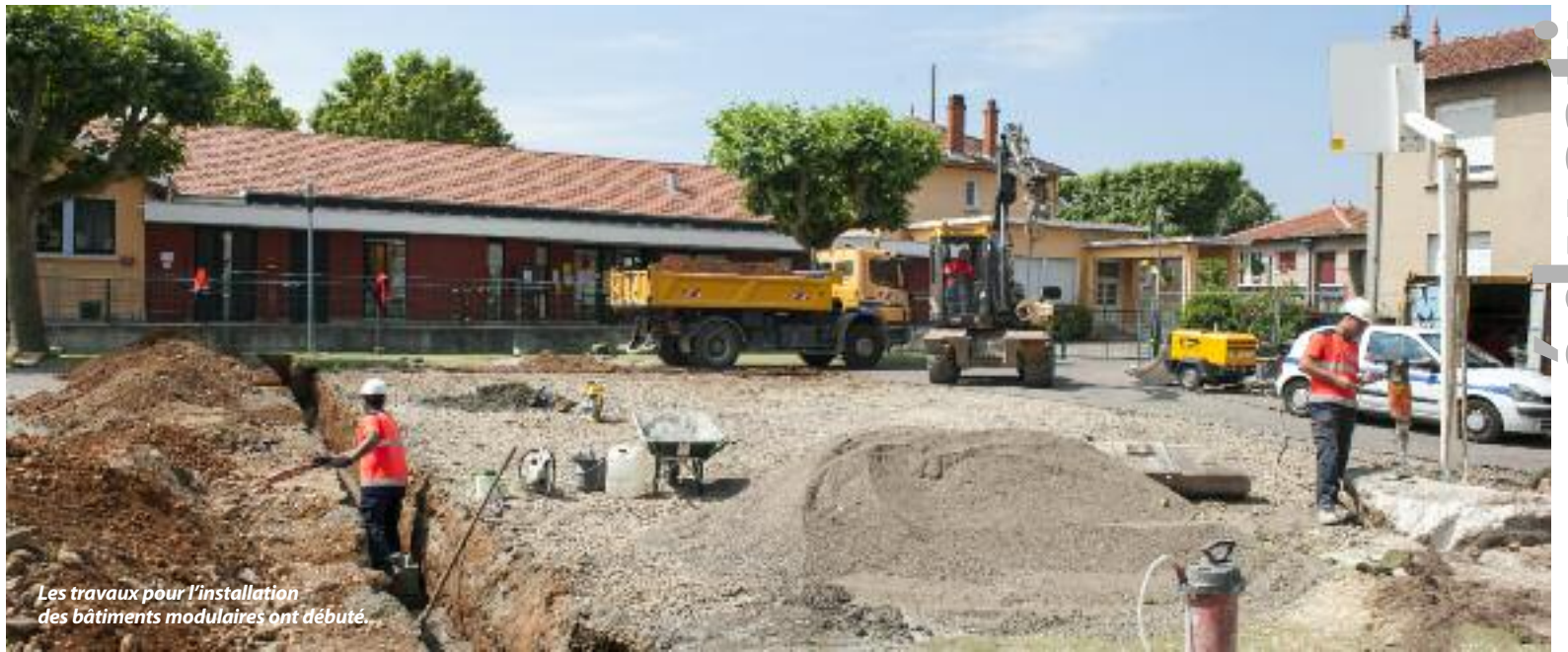
Les travaux pour l'installation des bâtiments modulaires ont débuté.

CE GROUPE scolaire, ouvert en 1953, fait l'objet d'un projet d'extension et de réhabilitation depuis 2012. Les travaux vont enfin commencer pour répondre aux besoins des habitants, dans un quartier en pleine mutation. Avant leur lancement, il est nécessaire d'installer des modules provisoires qui accueilleront les élèves durant le temps du chantier. Livrés en juillet, ils seront prêts à la rentrée. Pour rappel, ce projet vise à créer des classes supplémentaires (trois en élémentaire, une en maternelle), rénover entièrement l'école élémentaire ainsi que les espaces extérieurs et construire un