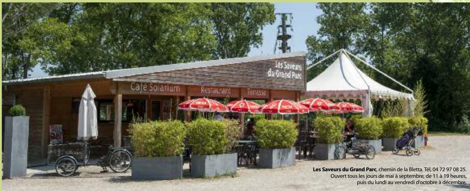
Les Saveurs du Grand Parc, chemin de la Bletta. Tél. 04 72 97 08 25. Ouvert tous les jours de mai à septembre, de 11 à 19 heures, puis du lundi au vendredi d'octobre à décembre.